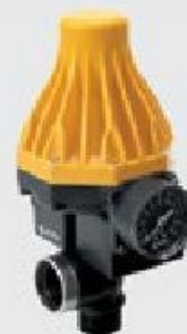
Блоки контроля потока WATERDRIVE 15, WATERDRIVE 22, PRESSDRIVE