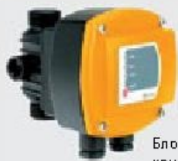
Блок контроля потока KIT 01