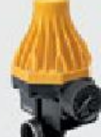
Блоки контроля потока WATERDRIVE 15, WATERDRIVE 22, PRESSDRIVE