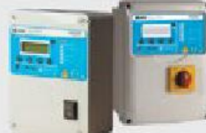
Устройство защиты и управления PROTEC