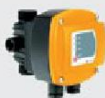
Блок контроля потока KIT 01