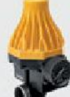
Блоки контроля потока WATERDRIVE 15, WATERDRIVE 22, PRESSDRIVE