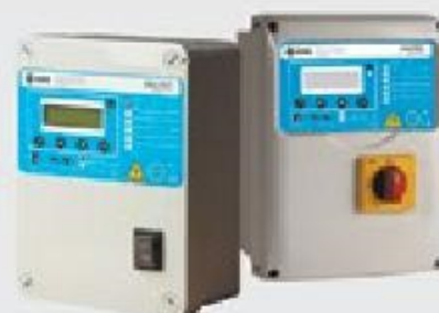
Устройство защиты и управления PROTEC