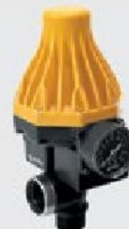
Блоки контроля потока WATERDRIVE 15, WATERDRIVE 22, PRESSDRIVE