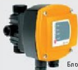
Блок контроля потока KIT 01