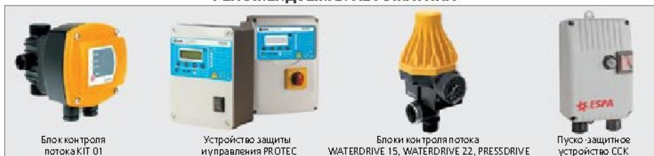
Блок контроля потока KIT 01